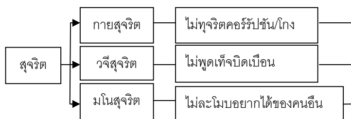
ตารางภาพที่ ๓.๑ ภาพแสดงหลักสุจริตเพื่อความโปร่งใสในการบริหารองค์กร

หากพิจารณาหลักการ “ความสุจริต” ทั้ง ๓ ประการนี้เราจะพบว่า เป็นหลักการของความโปร่งใสที่สัมพันธ์กับการป้องกันการคอร์รัปชัน ซึ่งก็สอดคล้องกันดังแผนภาพด้านล่าง