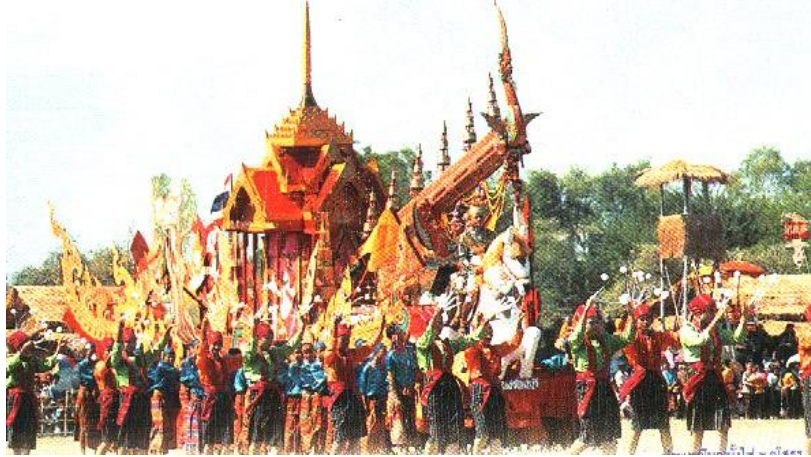
ภาพที่ ๑ ประเพณีบุญบั้งไฟ