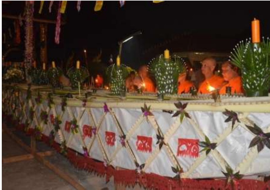
ภาพประเพณีไหลเรือไฟบวักวัดบ้านห้วยลึก